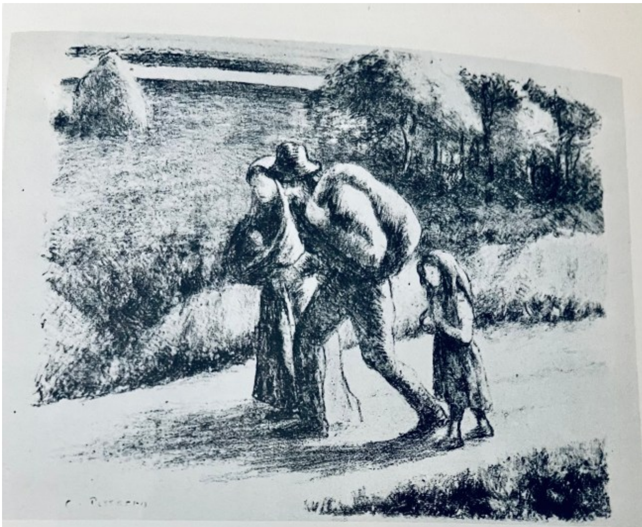
36. Les Trimardeurs (litografia). Bibliothèque Nationale, Parigi.